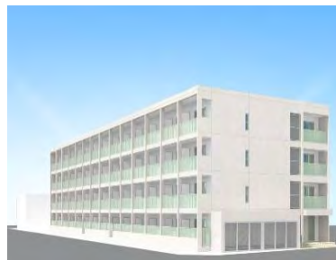
「フローライト小若江」外観イメージ